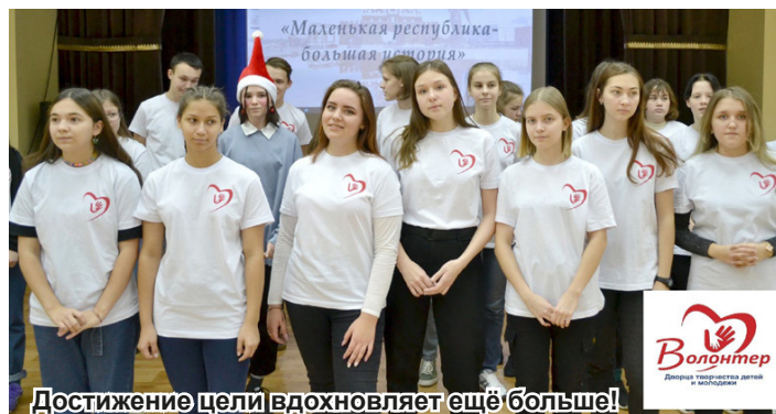
Достижение цели вдохновляет ещё больше!