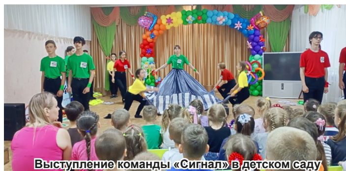
Выступление команды «Сигнал» в детском саду