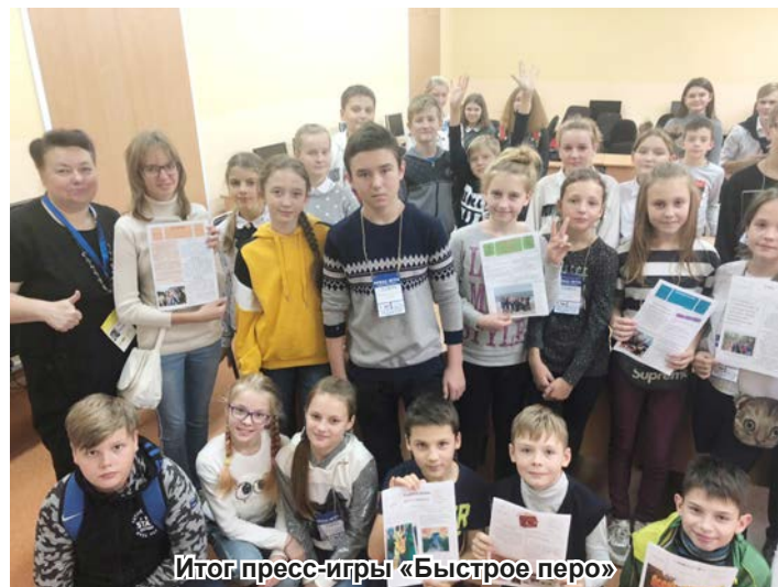
Итог пресс-игры «Быстрое перо»