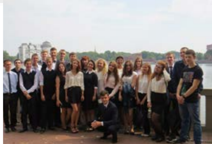
Рисунок: Снежанна Катаева

Скажу сразу, этот вопрос достаточно сложен, и я не буду агитировать за ту или иную позицию. В этом году я достаточно тесно сотрудничал с президентским советом, видел все положительные и отрицательные моменты его работы. Я постараюсь быть объективен и объяснить вам все плюсы и минусы ученического самоуправления. По своей доброй традиции я начну с минусов. Одним из них является время, а вернее его отсутствие. Зачастую ты просто не успеваешь всего сделать, постоянно приходится во всем учувствовать, что в итоге вытекает в другую проблему, а именно с учебой. Работая в ученическом самоуправлении, ты находишься между двух огней. С одной стороны, постоянно наваливающиеся мероприятия, а с другой бесперебойный ропот учителей о том, что это ученическое самоуправление никому не нужно, и лучше бы ты занялся учебой. Постоянно приходится искать зо-