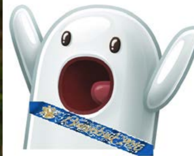
4. Роман Воронков